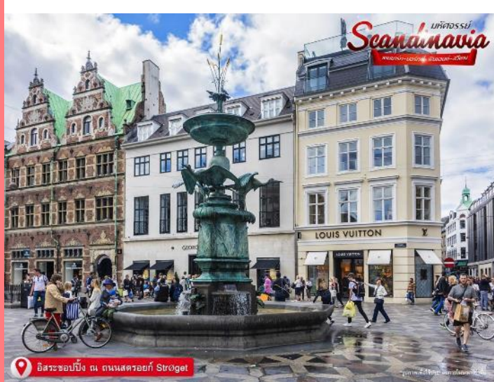
อิสระช้อปปิ้ง ณ ถนนสตรีทอเก้ Strøget

ให้ท่านได้ อิสระช้อปปิ้ง ณ ถนนสตรีทอเก้ (Strøget) ถนนคนเดินที่ยาวที่สุดในโลก ร้านบนถนนช้อปปิ้งสายหลักของเมืองนั้นเต็มไปด้วยแบรนด์ดังที่เราคุ้นเคยดี ตั้งแต่ Louis Vuitton ไปจน Urban Outfitter และ Zara ที่ไม่ว่าใครจะเข้ามาแล้วก็เมืองก็สาขาก็คงไม่สามารถหยุดขาตัวเองไม่ให้เดินเข้าไปซ้ำได้ แต่ที่น่าสนใจมากกว่าคือร้านของแบรนด์ดีไซเนอร์ท้องถิ่นชื่อดัง อย่าง Wood Wood, Stine Goya, Henrik Vibskov ที่ตั้งอยู่บริเวณนี้เช่นกัน