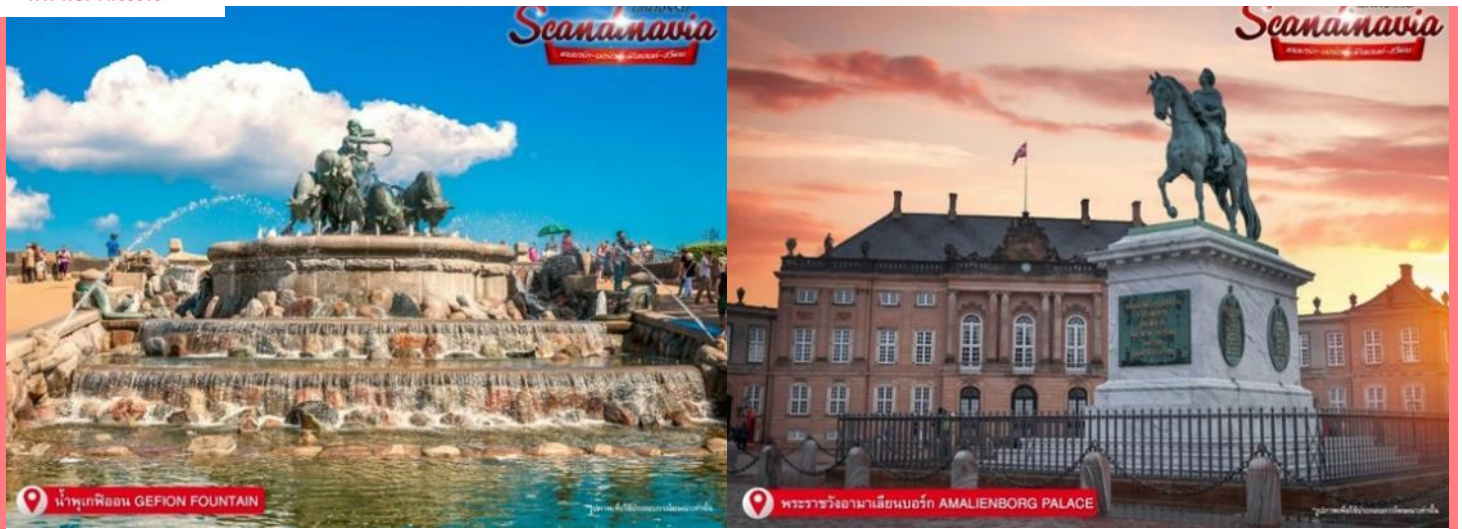
น้ำพุเก็ฟิออน GEFION FOUNTAIN